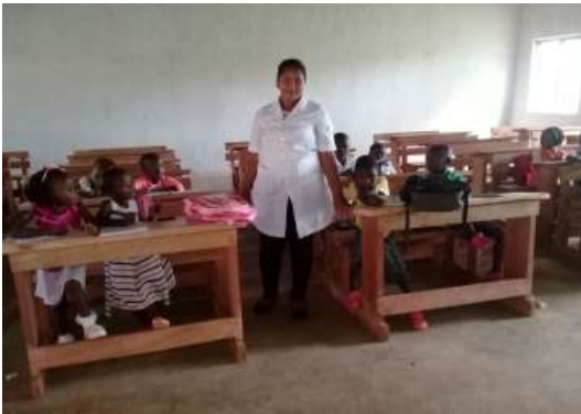
PRIMERE SKOOL : Hier is die Graad 1 juffrou wat die regering aan die skool voorsien het. Die skool banke was ook aan die skool geskenk