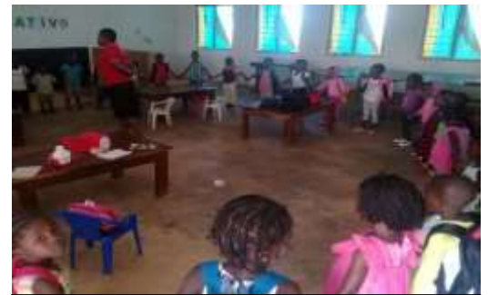
KLEUTERSKOOL : Oriëntering van die nuwe kleuterskool kinders van 2018.

Die kleuterskool in Milange vorder mooi en natuurlik is ons ook daarvoor vir die Here baie dankbaar want ... die kleuterskool word op 'n self-volhoubare wyse bestuur! Die ouers van die kinders dra getrou tot die skoolfonds by waarmee onderwysers vergoed word en kos aan die kindertjies voorsien word